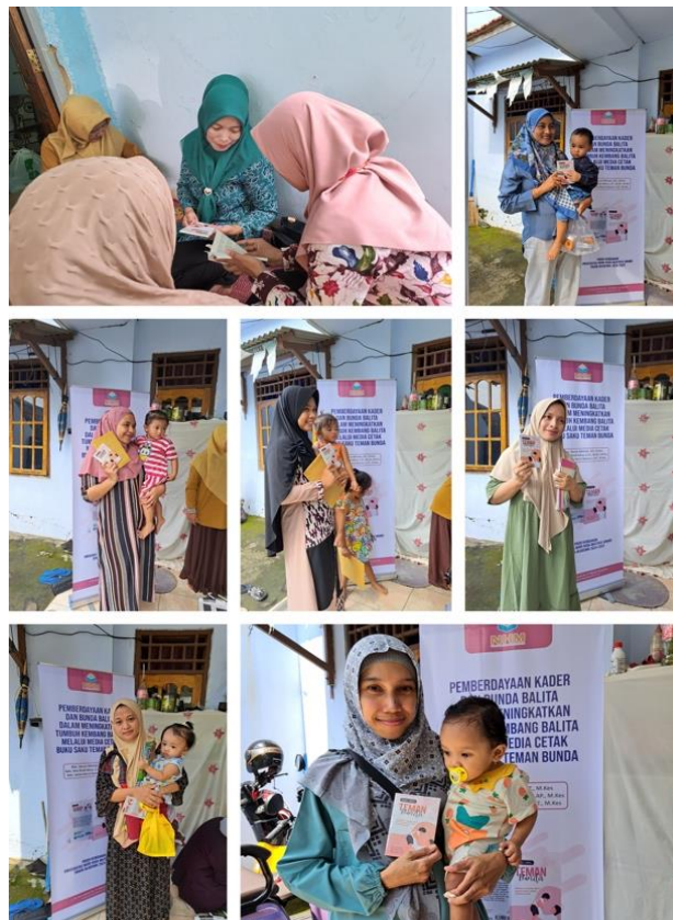
Gambar 1. Pelaksanaan edukasi dan pemberian buku saku teman Bunda kepada Bunda balita

Pada gambar 1. adalah pelaksanaan edukasi tentang tumbuh kembang balita kepada Bunda balita. Peserta edukasi yang dilakukan berjumlah 88 orang Bunda balita,