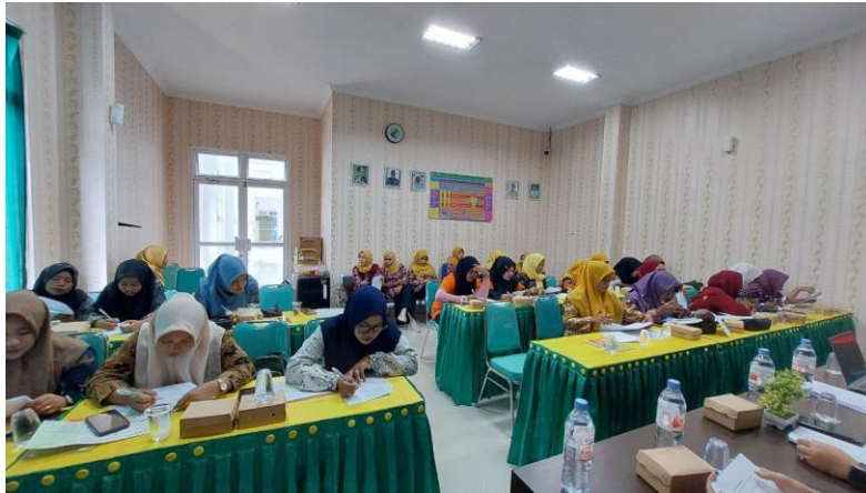
Gambar 5. Posttest Pengetahuan Kompetensi Dasar Pengelolaan posyandu