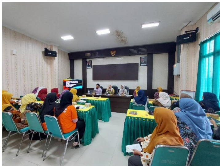
Gambar 2. Pembukaan Pelatihan kader posyandu