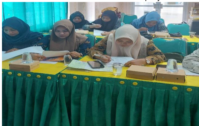
Gambar 4. Pretest Pengetahuan Kompetensi Dasar Pengelolaan posyandu