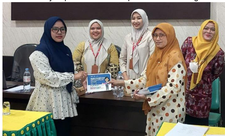
Gambar 7. Pemberian Booklet Materi Kompetensi Dasar Pengelolaan posyandu