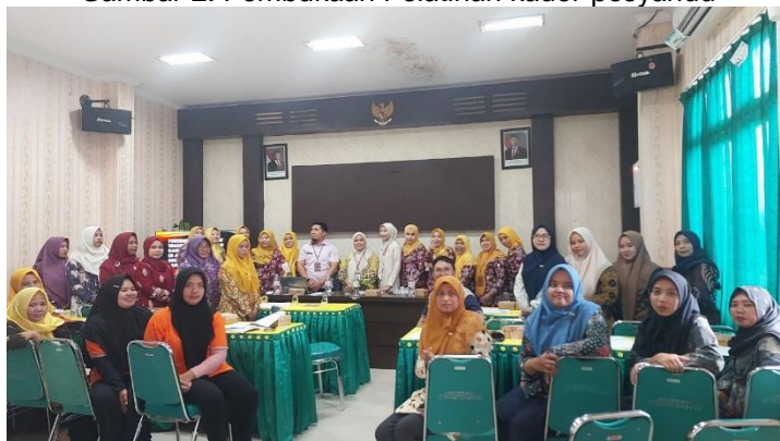
Gambar 3. Pelatihan kader posyandu