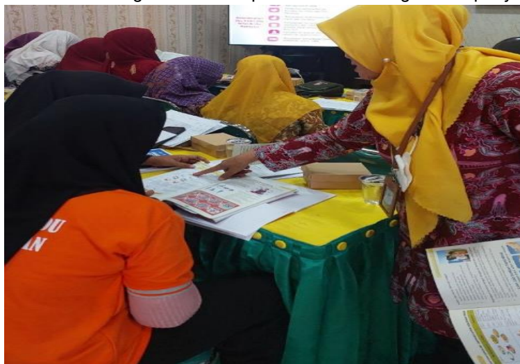
Gambar 6. Penyampaian Materi Kompetensi Dasar Pengelolaan posyandu