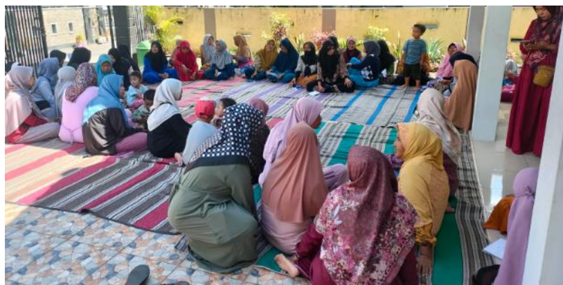
Gambar 2. Pelaksanaan Pengabdian Masyarakat