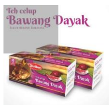
Gambar 1. Teh bawang Dayak

Bawang Dayak dapat disajikan dalam berbagai bentuk sediaan manisan, serbuk, minuman instan/ teh, Konsumsi dalam bentuk segar dan praktis bisa diminum kapan saja. Sayangnya, sumber utama a herbal yakni bawang Dayak susah didapatkan secara langsung, namun bisa dipesan secara online.